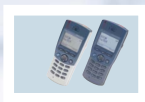
Ascom 9d24 Medic & Protector