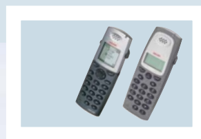
Ascom OfficeM & OfficeT

Les anciens combinés DECT tels que DT288, DT290, DT368, DT570, TH688 et 9d23 ainsi que les derniers combinés Ascom DT292, OfficeT, DT590, OfficeM et 9d24, 9d24MKII sont compatibles avec notre solution IP-DECT. Cette compatibilité signifie que tout système DECT-1800-GAP, MD Evolution, BusinessPhone ou MD110, utilisant la norme DECT GAP et/ou CAP, peut être remplacé par l'IP-DECT.