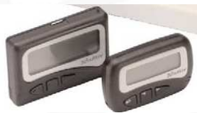
RECHERCHE DE PERSONNE (BIP)