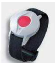
APPEL MALADE RADIO MALADEADIO